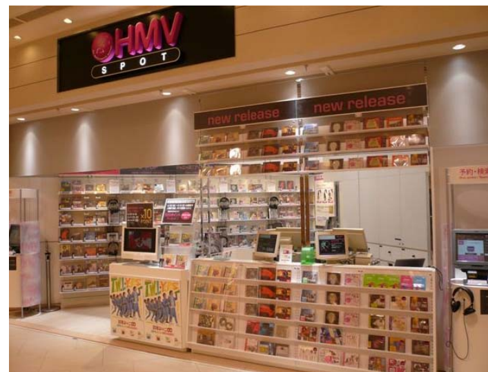
HMV SPOT あべのキューズモール (小型店の事例)

(*) 2011年8月よりHMVジャパンもPontaに加盟し、HMV会員をPonta会員へ移行予定