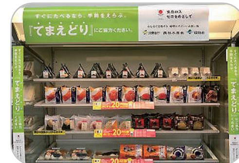
食品ロスへの取り組み 「てまえどり」