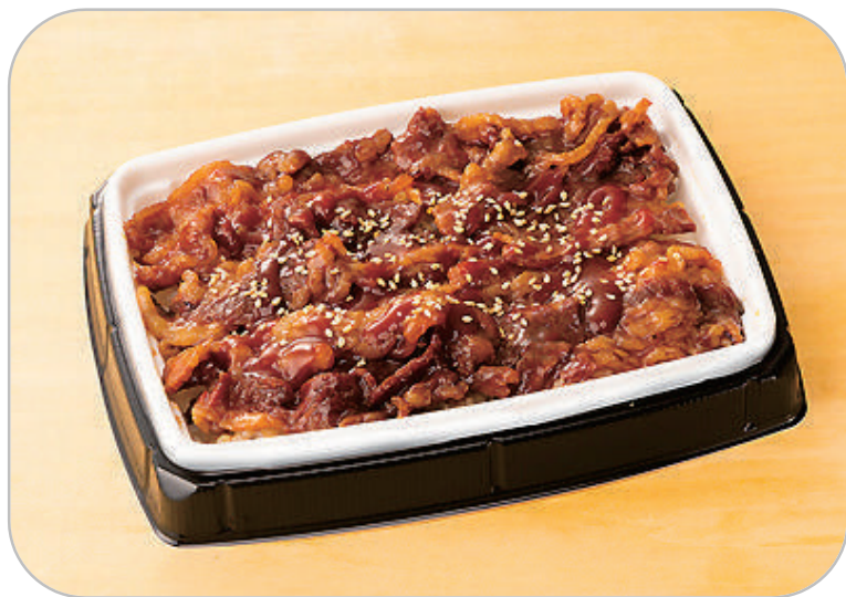
焼肉トラジ監修 牛カルビ焼肉重