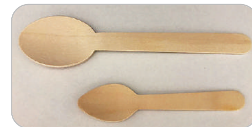
木の素材のスプーン